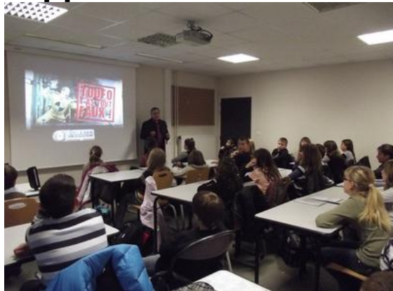
Des élèves attentifs grâce au support vidéo.